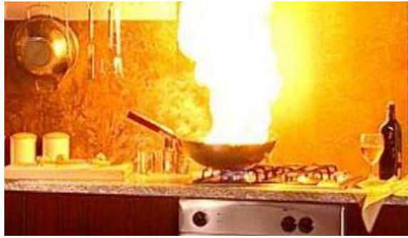
4. kép Konyhai olajtűz.

Amennyiben tűz az edényből továbbterjedt a konyhabútorra, azt a tűzoltókészülékkel oltjuk el.