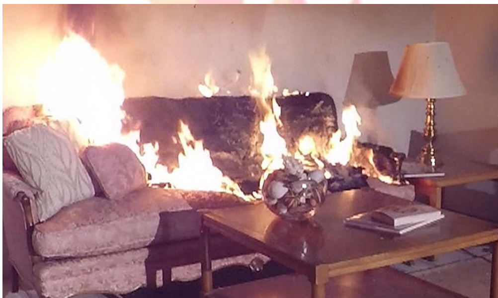
6. kép Bútor égése.

Szilárd anyagok (bútorok, szőnyegek, textíliák, stb.) égésénél (6. kép) használhatunk vizet, vagy porral oltó készüléket is.