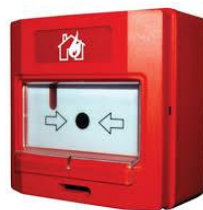
1. kép Kézi jelzésadó.

Amennyiben beépített tűzjelző rendszer van telepítve, és az a tűz észlelésének időpontjában nem ad riasztási jelzést, a legközelebbi kézi jelzésadó aktiválásával ( 1. kép ) tűzjelzést kell indítani.